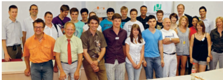
Teilnehmer der Gründungsveranstaltung am 09. Juli 2010

Die folgenden Ausführungen geben ein Portrait über die in Baden-Württemberg im Rahmen des Projekts kooperierenden Unternehmen und hier für das Schuljahr 2010 / 11 eingesetzten Juniorenfirmen.