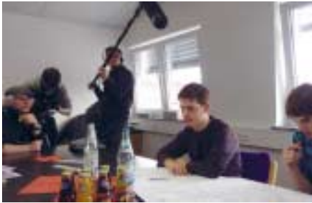
fechnermedia bei den Dreharbeiten

Ein besonderer Höhepunkt des Projektes „Juniorenfirmen auf dem Weg zum nachhaltigen Wirtschaften“ war die Produktion des gleichnamigen Films. FechnerMEDIA erstellte im Auftrag von UnternehmensGrün für die Umwelt-Bildungskonferenz am 24. Februar 2011 (vgl. den Konferenzbericht in dieser Ausgabe) eine Dokumentation über die Arbeit von vier Juniorenfirmen in ihren jeweiligen Mutterunternehmen. Den Film finden Sie unter folgendem Link: http://www.nachhaltige-juniorenfirmen.de/Film.74.0.html