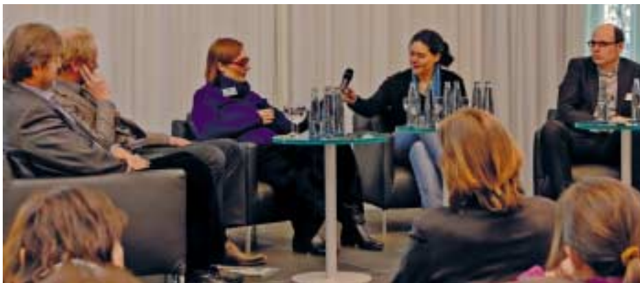
Podiumsdiskussion: Bildung für nachhaltiges Wirtschaften – Wege zur Umsetzung

Bericht über die Umwelt-Bildungskonferenz vom 24. Februar 2011 in der Vertretung des Saarlandes beim Bund in Berlin, gefördert durch das Bundesumweltministerium (BMU) und das Umweltbundesamt (UBA).