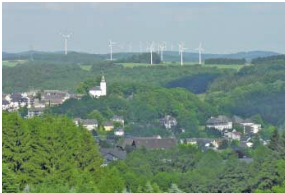
Windpark in Bad Marienberg im Westerwald

Die Wirkungsmechanismen des EEG haben gesellschaftliche Kräfte mobilisiert: Größtenteils ist der heute erreichte Anteil erneuerbarer Energien das Werk von Bürgern und Gemeinden, sowohl hinsichtlich der Investition als auch der Erzeugung. Das Schlüsselement bildet dabei die Dezentralität: Energiegewinnung und Energienutzung liegen nah beieinander. Für diese Entwicklung bedurfte es keines Supergrids, das die gewonnene Energie über hunderte oder