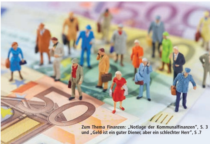
Zum Thema Finanzen: „Notlage der Kommunalfinanzen“, S. 3 und „Geld ist ein guter Diener, aber ein schlechter Herr“, S. 7