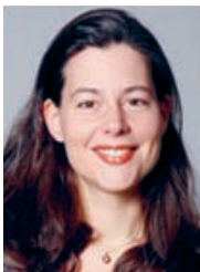
Dr. Nina Scheer

Als Markteinführungsprogramm für Erneuerbare Energien sollte das Gesetz mit dem Mittel der Abnahmepflicht regenerativer Energie und einer – degressiv ausgerichteten – garantierten Einspeisevergütung den Erneuerbaren Energien-Technologien zur Massenproduktion verhelfen. Dass dieses Gesetz eine Erfolgsgeschichte ist, beweisen inzwischen nahezu 300.000 in der Erneuerbare-Energien-Branche entstandene und auf das Gesetz zurückzuführende Arbeitsplätze. Die Vergütungssätze sollten für Investitions- und Planungssicherheit sorgen.